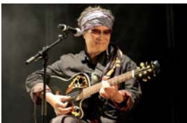
EDGARD RAVAHATRA

(G)Rêve Général(e) : Iyannaj kont pwofitasyon (ensemble contre les profits excessifs). Voir page 14. Débat suivi d'un concert de solidarité : voyage dans la culture sénégalaise avec Ch'Ti Teranga , puis dans la chanson francophone avec Edgard Ravahatra qui, de sa voix chaude et colorée, nous propose un cocktail épique pour une musique agréablement métissée. ■ Casino, rue Émile Legrelle Prix d'entrée libre : les recettes seront reversées au Secours Populaire en solidarité avec le peuple malgache.