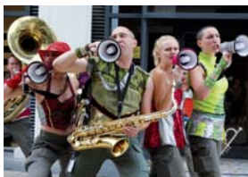
DISSIDENT CHABER

Du rire, de l'émotion, du rock'n'roll... Dissident Chaber invente la face cachée de vos vinyles favoris. Les hits les plus ringards prennent une tournure détonante dans un show tendance en treillis & paillettes!!!